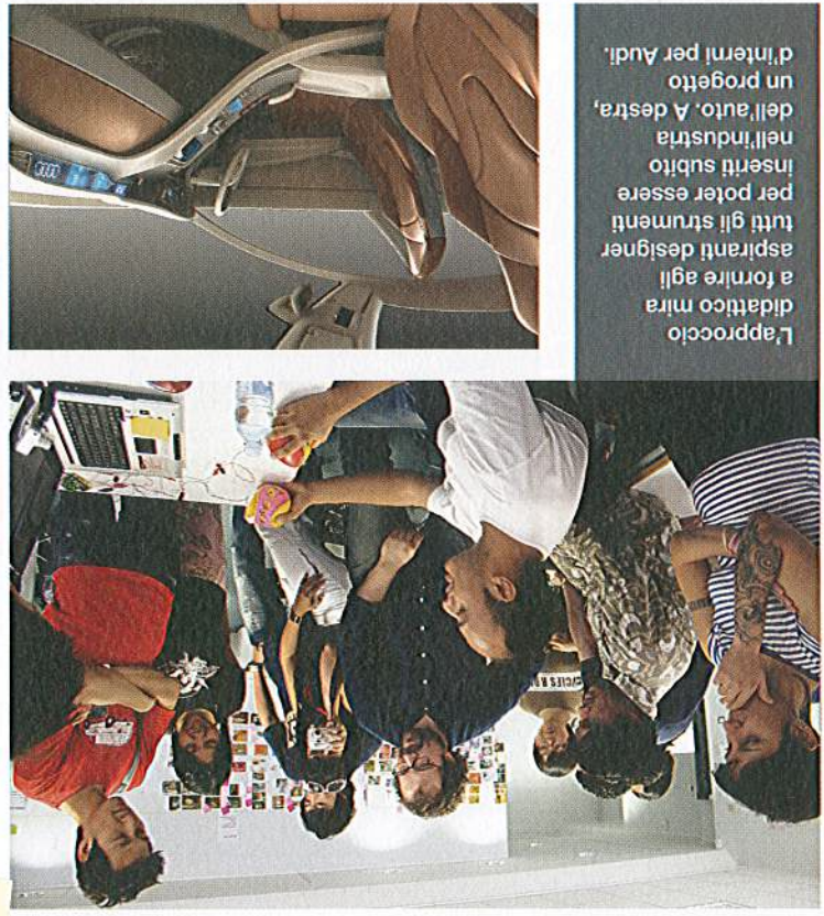
L'approccio didattico mira a fornire agli aspiranti designer tutti gli strumenti per poter essere inseriti subito nell'industria dell'auto. A destra, un progetto d'interni per Audi.

Carzeta, importatore esclusivo per l'Italia, presenta la nuova Alpina B3 Bi-Turbo Allrad Pensavate che una guida divertente, sportiva, dinamica e allo stesso tempo una guida sicura su fondo stradale bagnato o su neve fossero inconciliabili? Per chi guida una BMW ALPINA non si tratta più di una contraddizione. Dall'autunno 2008, ALPINA amplia il suo programma di automobili presentando modelli a trazione integrale: la nuova ALPINA B3 BI TURBO a trazione integrale, nelle varianti Berlina, Coupé, Touring